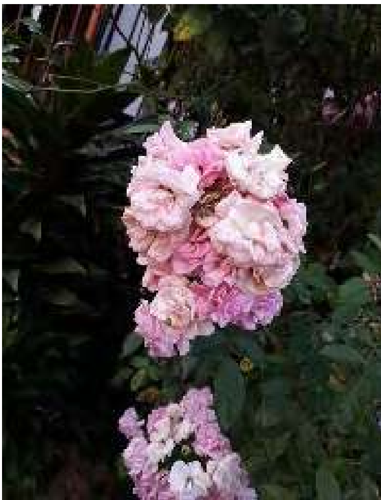
Figura 8. Trabajo de fotografía, quien la toma y selecciona significa el cuidado

Para referirse a la vida, Merlina realiza la fotografía de un árbol y dice: