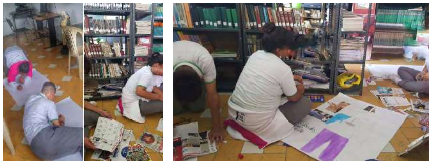
Figura 6. Trabajo de dibujo de cuerpo narrado

Luego, se recogió el conjunto de los relatos, se preguntó por la manera como se habían sentido. Cada uno narró su dibujo de cuerpo a los otros y se dio una conversación respecto a las emociones, lo que pensaban y lo que querían comentarles a los otros sobre su propio dibujo del cuerpo, así como el de los demás participantes. Esta exposición les permitió encontrar puntos comunes y divergencias, con estas se alimentó aún más el dibujo corporal.