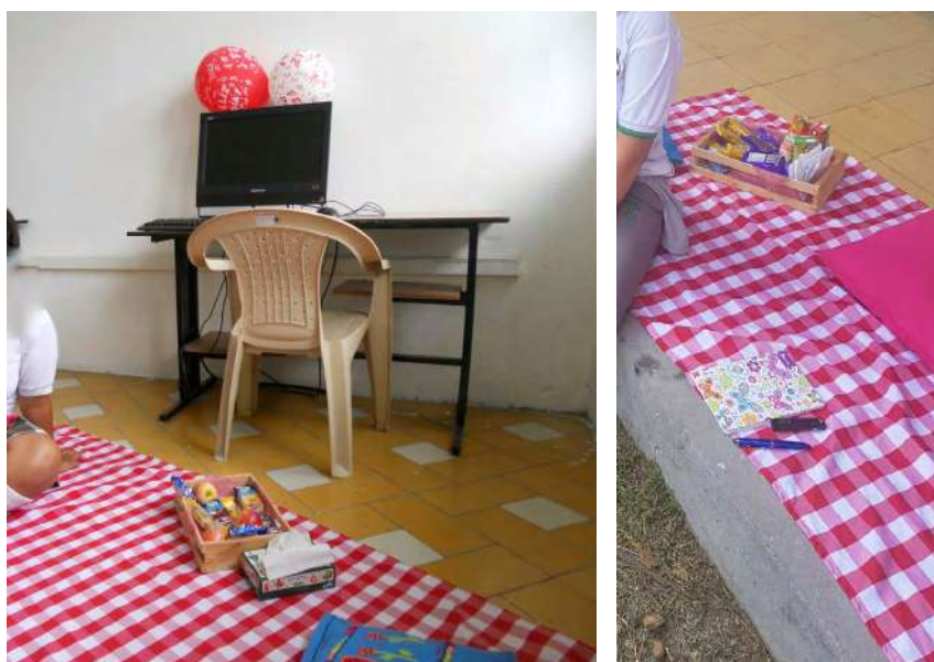
Figura 3. Espacio de entrevista

El relato de una vida se construye a partir del encadenamiento de hechos significativos. Denzin (1989) los llama epifanías o turning points , momentos críticos. Se realizaron entre tres y cuatro encuentros, según fue necesario. De acuerdo con Bolívar et al., (2001), estas sesiones pueden parecerse a una conversación, pero el autor aclara que no es una conversación, “porque otro es quien habla y la voz del investigador permanece en un segundo plano escuchando, ofreciendo apoyo y estímulo” (p. 16).