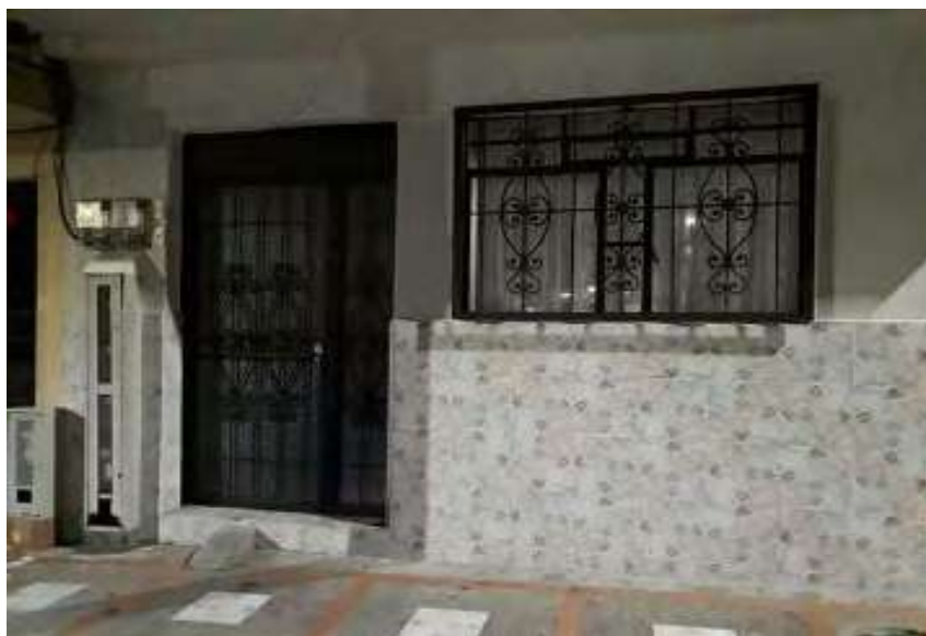
Figura 5. Una de las fotos del trabajo de fotografía

Chara demostró que le gustaba hablar; por su gran capacidad narrativa fue con quien se tuvieron más encuentros. Esto permitió comprender lo que significaba para ella la vida, la muerte, el dolor, el cuerpo, el pasado, el presente y el futuro.