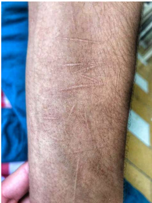
Figura 11. Marca corporal

incomunicable siendo el dolor el signo de su humanidad (1999, p. 7). El cuerpo es una superficie de proyección cuya alteración ridiculizante testimonia el rechazo radical que hace cierta juventud de sus condiciones de existencia (2007, p. 37).