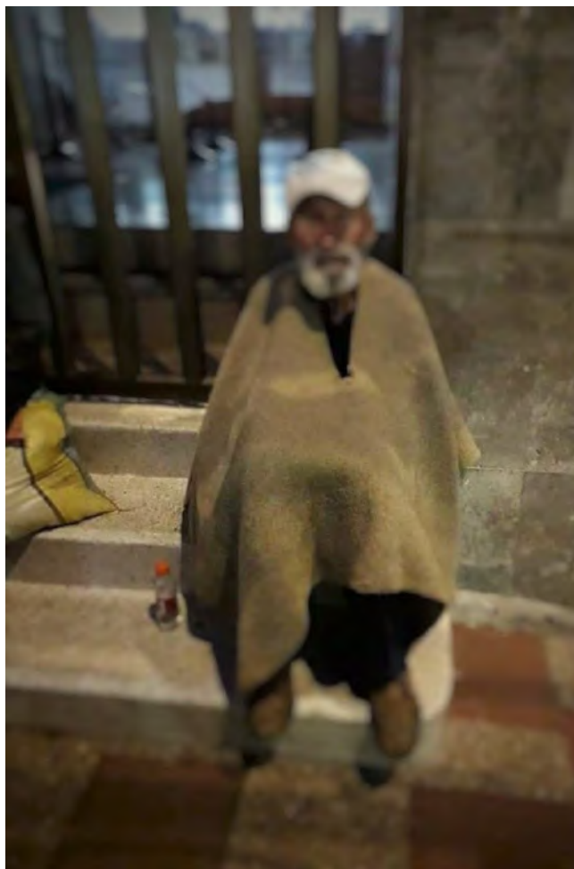
Figura 16. Trabajo de fotografía, quien lo realiza significa el dolor.

“Uno sufre cuando le pasa algo, cuando uno no tiene quién lo escuche, a quién contarle cosas; cuando uno simplemente se deja llevar por el dolor y se tira a los malos pasos y al final uno quedar solo y sin nadie, quedar metiendo drogas y dañarse uno mismo. La vida es como el señor (fotografía de un anciano en condición de mendicidad), está solo sin nadie y con un inmenso dolor en el alma”.