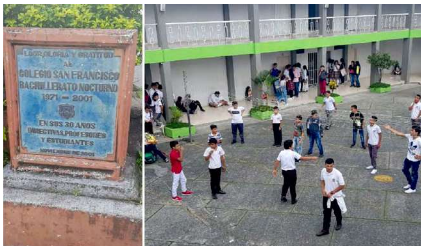
Figura 1. Institución Educativa San Francisco de Paula, Chinchiná, Caldas