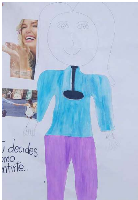
Figura 10. Dibujo de cuerpo narrado

De otro modo, a través del dibujo del cuerpo narrado, Chara dibuja en su garganta el vacío que siente. De acuerdo con Rolnik (2019), en guaraní, la palabra garganta significa el nido de palabras. Y palabras significa