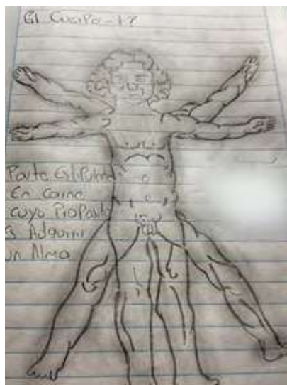
Figura 13. Trabajo de dibujo, quien lo realiza significa el cuerpo. Fuente: dibujo realizado por Sebastián

Sebastián, a través de su mapa de cuerpo narrado, se interroga por su existencia en el mundo, su misión y su esencia: