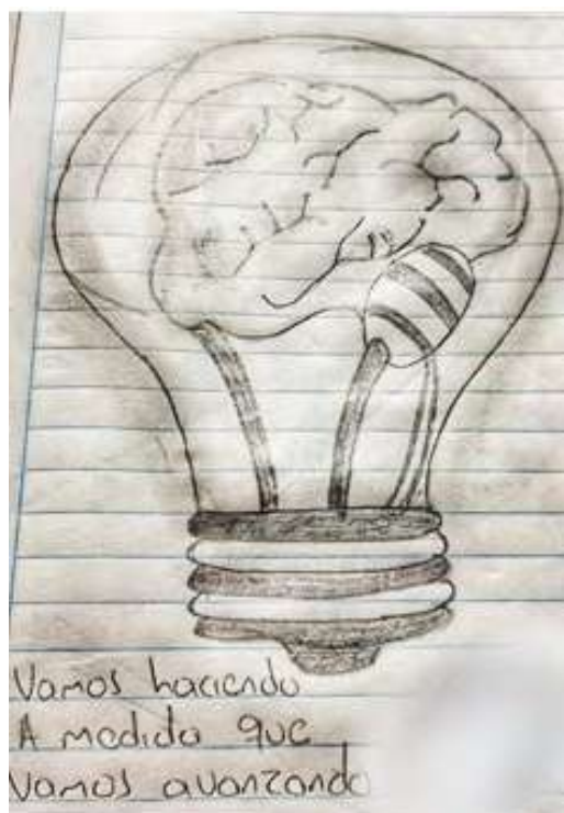
Figura19. Trabajo de dibujo, simboliza el presente Fuente: dibujo hecho por Sebastián

A través del dibujo proyecta su futuro. Sebastián dice: “Me encanta la pintura. Yo soy dibujante, practico mucho el dibujo”. Esto es un devenir molecular en el sentido en que configura cierto tipo de universo, no se trata solo de sublimar Guattari y Rolnik (2006, p. 97).