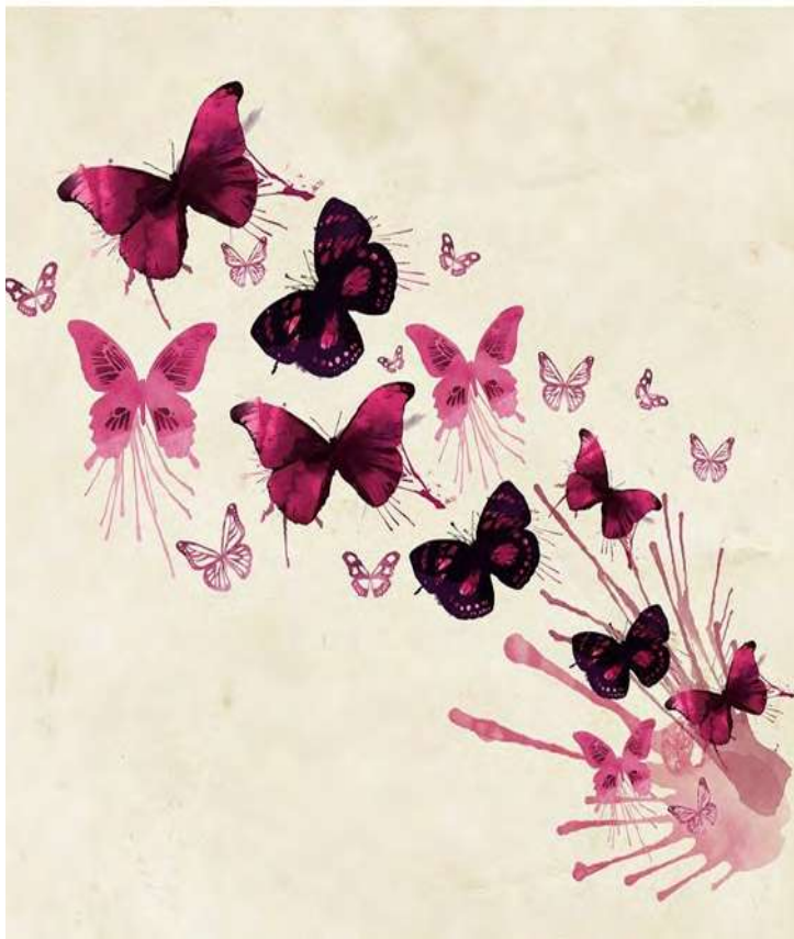
Figura 7. Carátula del pequeño libro con las narrativas autobiográficas