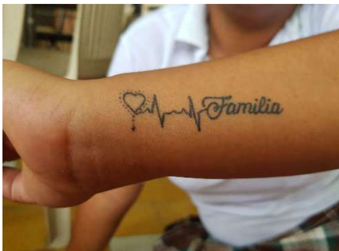
Figura 18. Marca corporal

Los vínculos familiares son una fortaleza para los jóvenes; cuando no se encuentran los más cercanos como el de la madre y la abuela, otros vínculos como los de los hermanos y de los padres, que han estado ausentes y se restauran, pueden influir de manera positiva en los jóvenes. Así lo relata Sebastián: