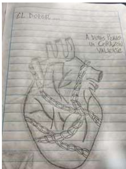
Figura 12. Trabajo de dibujo, quien lo realiza significa el dolor. Fuente: dibujo realizado por Sebastián