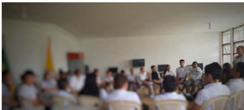
Figura 2. Encuentro conversacional exploratorio

En este encuentro conversacional exploratorio, les indiqué que deseaba entender y aproximarme a la manera de pensar de los jóvenes, conocer sus percepciones respecto a: ¿Qué es la vida? ¿Cómo ven la vida? ¿Por qué es importante vivir? ¿Qué piensan respecto a la muerte? ¿Cómo ven la vida y la muerte en este país? ¿Qué casos cercanos de muertes han tenido? ¿Frente a otro tipo de muerte, en el que las personas se suicidan, qué piensan? ¿Han tenido experiencias cercanas de suicidio? ¿Han pensado en algún momento en hacerlo o lo han sentido? ¿Qué les ha pasado y cómo lo han experimentado? ¿Conocen personas